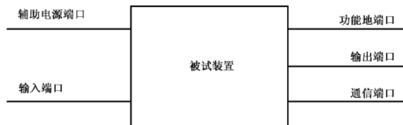
图 1 量度继电器和保护装置的试验端口